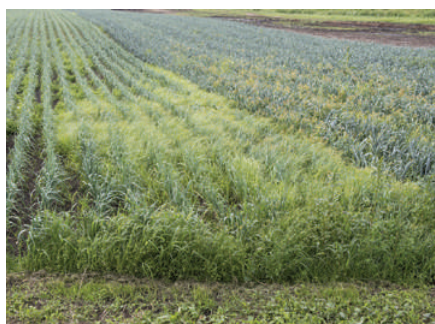
Erdmandelgras in Lauch.