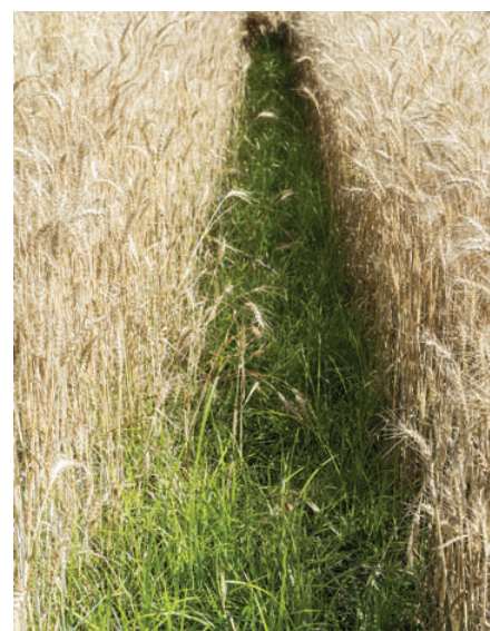
Erdmandelgras kann Licht und Platz in Fahrgassen oder sonstigen Lücken sehr gut ausnützen.

Unsachgemäss eingesetzte Herbizide können zu vermehrter Knöllchenbildung führen. Herbizideinsatz allein reicht somit für die langfristig erfolgreiche Bekämpfung nicht aus.