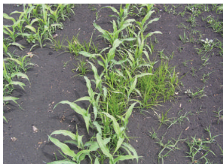
Schadbild in Mais. Knöllchen werden auch von Mäusen verschleppt.