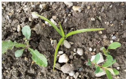
Keimling mit kräftigen Blattspitzen und gelblichen Blättern breitet sich oft als dreizackiger Stern aus.

Das weltweit vorkommende Erdmandelgras breitet sich auf den Feldern im schweizerischen Mittelland meist vegetativ mit rundlichen Wurzelknöllchen rasch aus. Nicht auszuschliessen ist die Vermehrung über Samen. Herbizideinsatz allein reicht nicht aus, denn nur die Kombination von Massnahmen verspricht Bekämpfungserfolg.