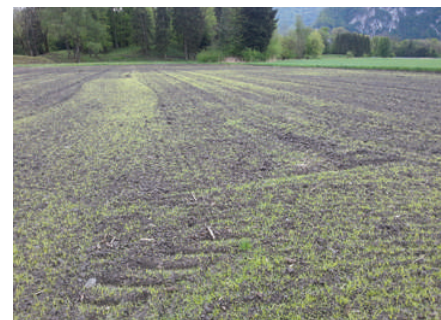
Im Frühjahr die Keimung fördern, um die jungen Pflanzen (2-5-Blatt-Stadium) vor der Knöllchenbildung mechanisch und chemisch zerstören zu können.