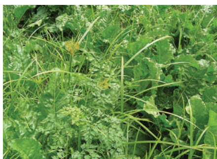
Erdmandelgras in Zuckerrüben