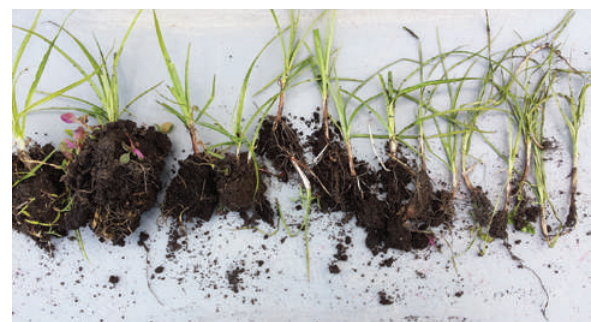
Trennen der Triebe von weissen Rhizomen und Knöllchen (rechts) ist das Ziel der Bodenbearbeitung.

Gut wirksame herbizide Wirkstoffe sind S-metolachlor ( Dual Gold , Sonderbewilligung), eingearbeitet vor der Maissaat sowie Sulfosulfuron ( Monitor mit Netzmittel) im Nachauflauf (NA) im Frühjahr in Winterweizen und Triticale. Der oft erwähnte Wirkstoff Halosulfuron wirkt nicht besser als Dual Gold oder Monitor . Im NA-Mais zeigten Equip Power und Titus + Callisto resp. Calaris sowie Principal + Gardo Gold in Praxisversuchen eine gute Wirkung. Eine Unterblattapplikation von Bentazon in Mais kann das Erdmandelgras zusätzlich schwächen. Glyphosate wirkt nur auf junge Pflanzen befriedigend.