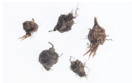
Die rundlichen Knöllchen sind robuste Überwinterungsorgane. Sie werden hauptsächlich durch menschliche Tätigkeiten verschleppt.