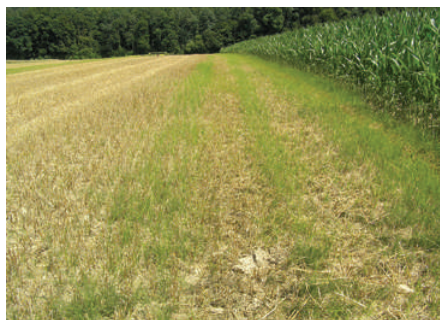
Verschleppung im Feld in Richtung der Bearbeitung.